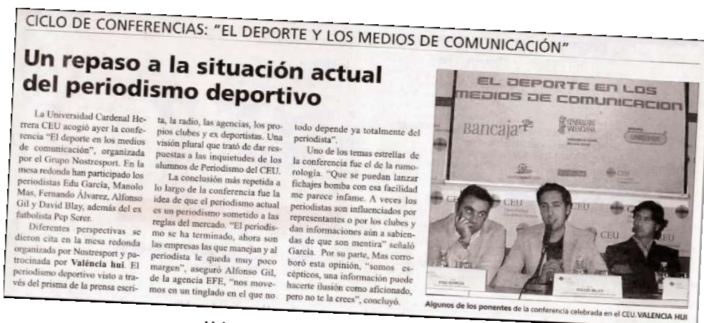
Valencia Hui 4 mayo 2007. Pág. 45