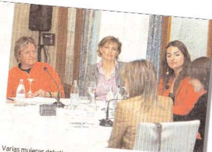
Varias mujeres debatieron ayer en Valencia sobre el deporte femenino.

NIURKA MONTALVO Récord en longitud en España